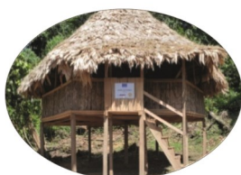
Territorio Bribri de Panamá