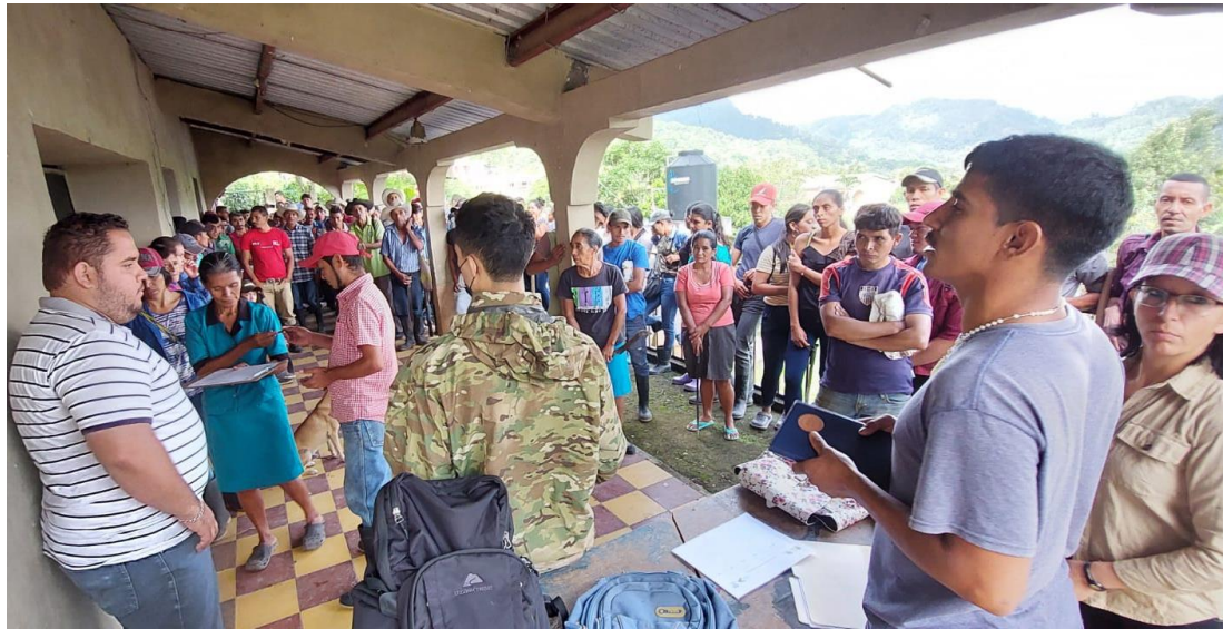
Ilustración: Involucramiento de las comunidades de Azacualpita y Teposuna.