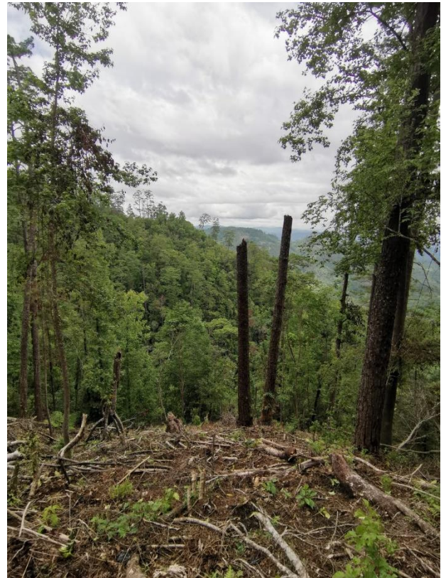
Ilustración: Área Deforestada