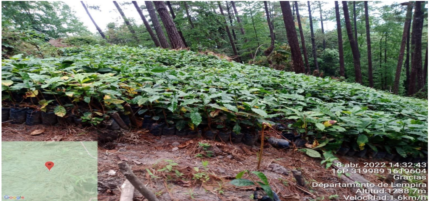
Ilustración 1: Encontrando vivero de café.