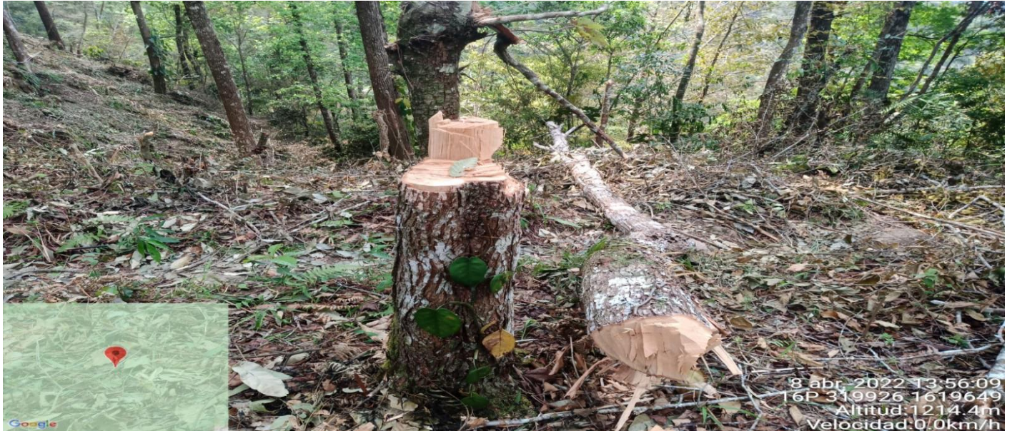
Ilustración 2: Área afectada.