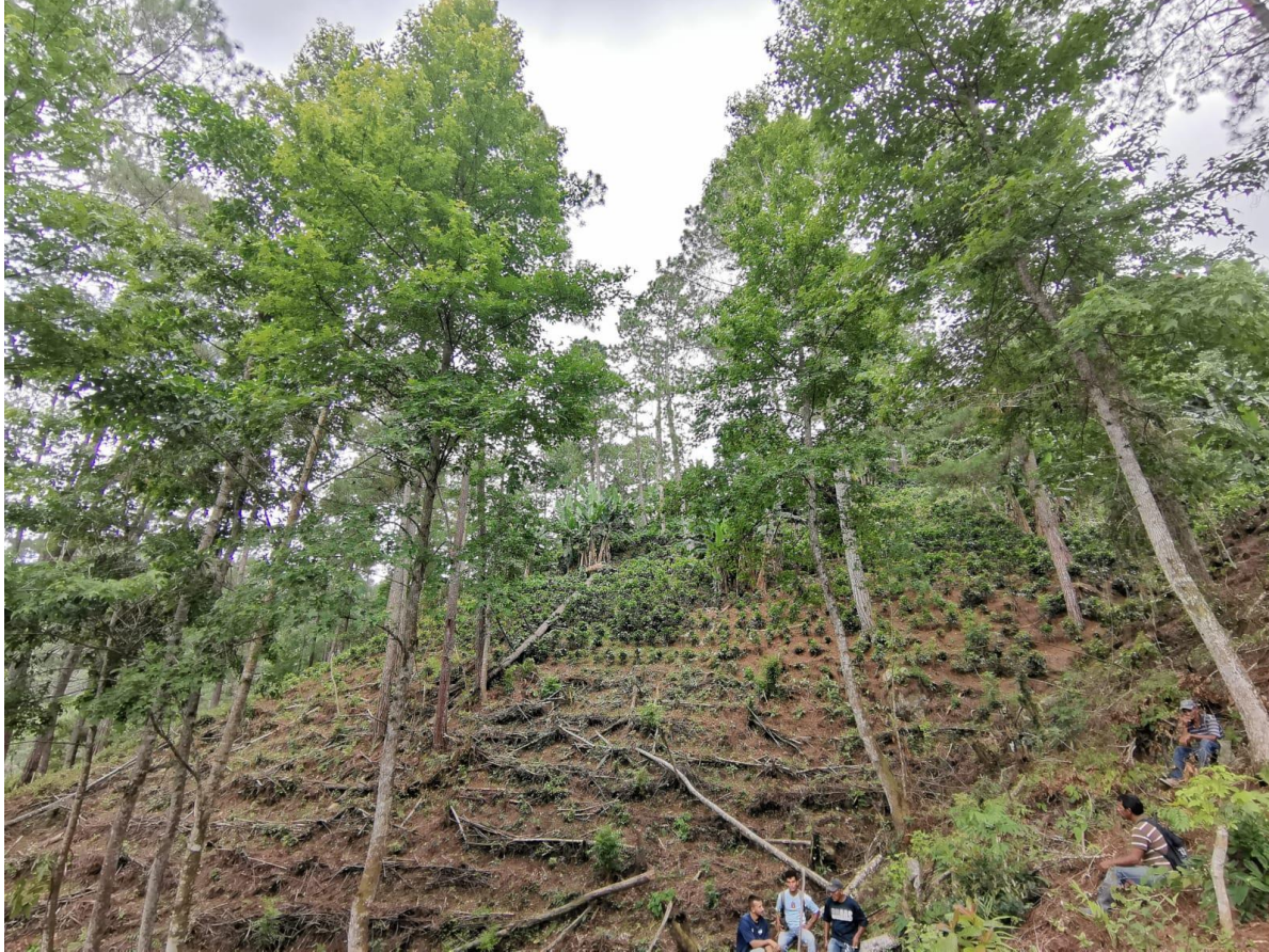
Ilustración: Plantas de café, en área deforestada.