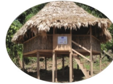
Territorio Bribri de Panamá