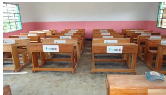
Vue intérieure de l'institut Kabunga

Pour améliorer les conditions infrastructurelles de base dans notre zone d'intervention, FODI a construit et équipé l'institut Kabunga grâce à l'appui financier du Ministère du Plan de la RDC à travers les Fonds de contre partie Congo-Japon.