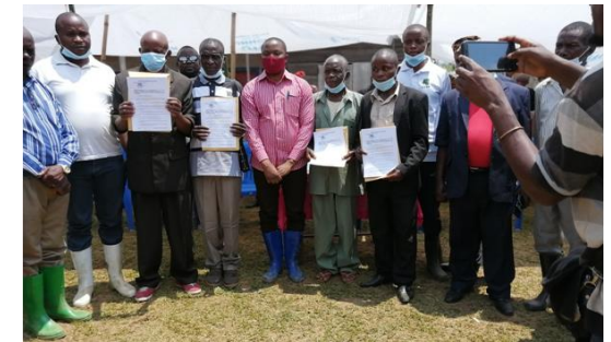
Remise des arrêtés d'attribution des CFCL par le Ministre Provincial en charge de la justice assumant l'intérim du Min Prov en charge de l'Environnement Etant donné que les CFCL appartiennent aux communautés, FODI a facilité la mise en place des organes de gouvernance de celles-ci à pendant les Assemblées Communautaires.

Pour ce qui est des actions de sécurisation des espaces forestiers des communautés, notre organisation a réussi à obtenir quatre arrêtés portant attribution des concessions forestières aux communautés locales Basengele, Banisamasi, Bananzigha et Bafuna-Bakano